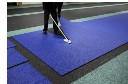
Demontage der MM- STocksport Sommerbahn